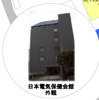
日本電気保健会館 外観