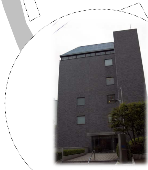
日本電気保健会館 外観